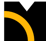
Multifunctioneel Centrum De Wijert / Helpman