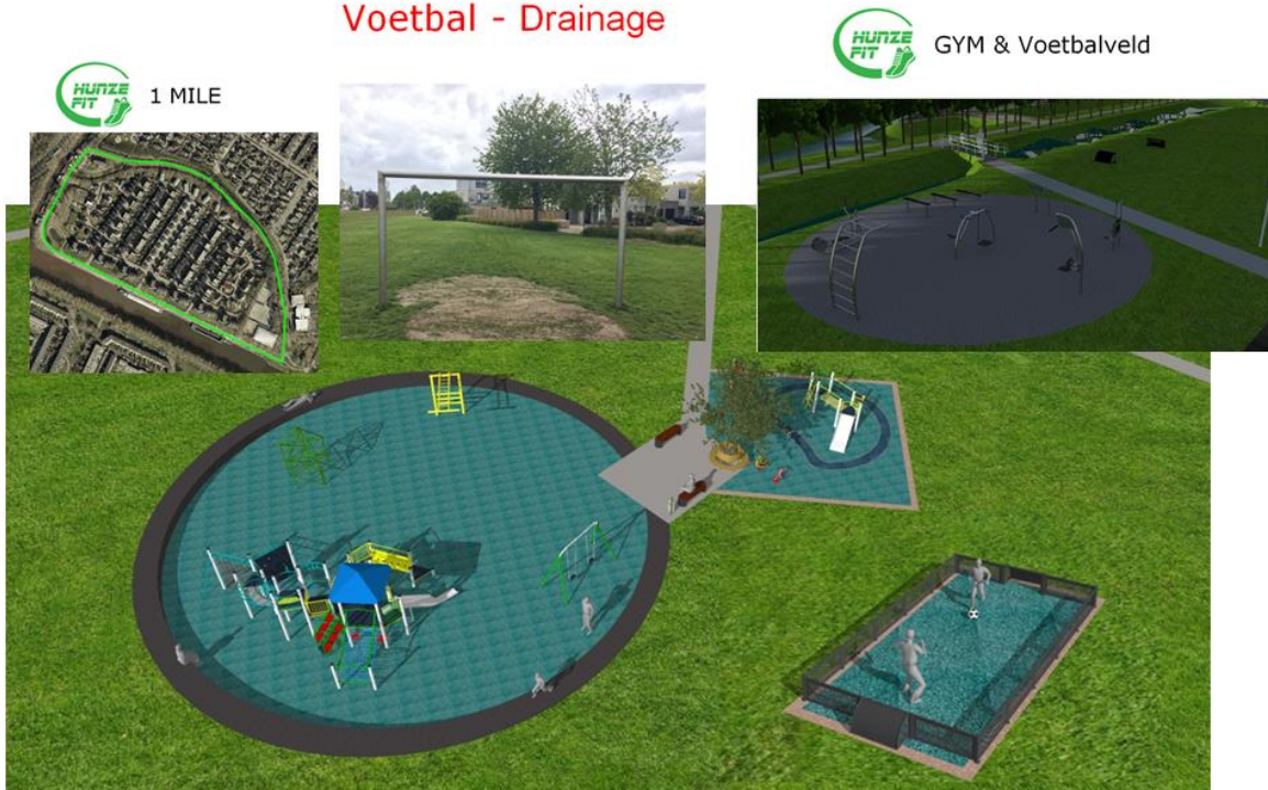
Klein overzicht plannen “bewegende Stad”